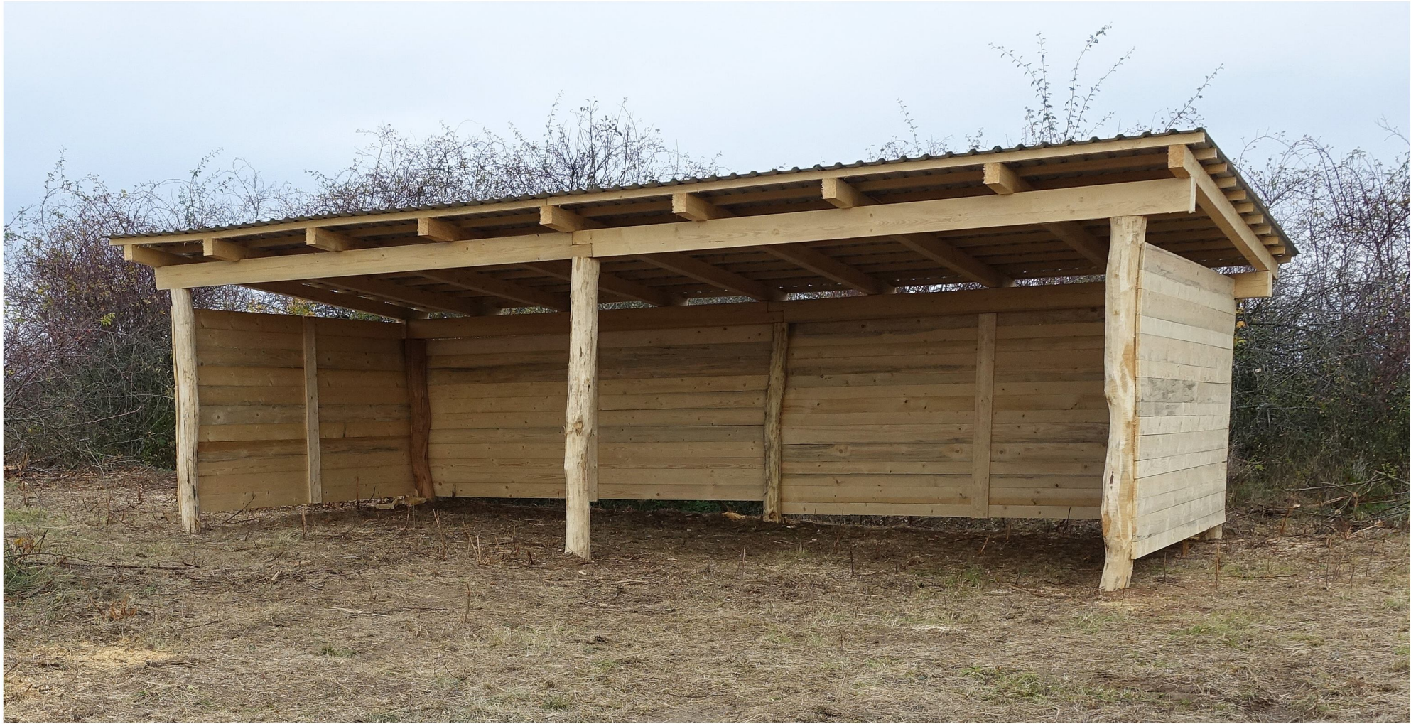
dřevěný přístřešek umístěný v aklimatizační ohradě rozměrů 8x4m